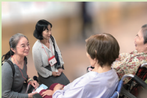
施設の利用者と面談するオンブズマン

老いは待ってくれません！親にはどんな施設がいいのか、自分はどうか…。介護が必要になったとき慌てないためにも今から学ぶとともに、「施設介護の質向上」のために、あなたも活動してみませんか。