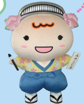
大阪市都島区社会福祉協議会 マスコットキャラクター「みやこりん」